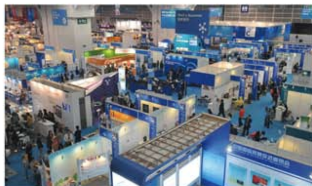
世界中小企業エキスポ2010

香港フォーラムと合わせて、同時期開催のイベントにも是非ご参加ください。詳細については香港貿易發展局東京事務所（Tel：03-5210-5850/e-mail：tokyo.office@hktdc.org）または大阪事務所まで（Tel：06-4705-7030/e-mail：osaka.office@hktdc.org）