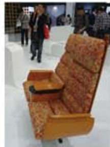
九州新幹線つばめのシート

ヤマハのテーブルと一体になった電子ピアノの大胆なデザインは、ピアノの周りにひとが集まり音楽を共有することがコンセプトだ。水戸岡鋭治氏デザインの九州新幹線つばめのシートには、柔らかい曲線を描く木製の板が使用されていて、木の温もりが伝わる肘掛は、海外から観光客にも好評であろう。富士山をイメージした「フジヤマ グラス」には思わず微笑んでしまう。北欧や韓国・中国の家電メーカーの急成長は、価格戦略だけではなく、デザインの向上も大きな要因の一つといわれている。