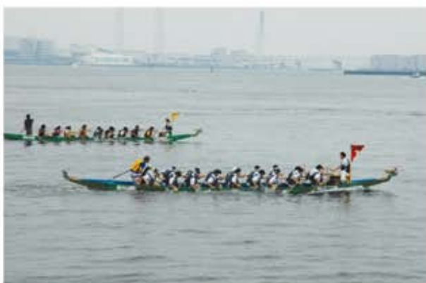
力走する日本香港協会「飛龍」艇（手前）