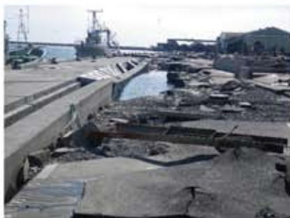
被災した石巻漁港