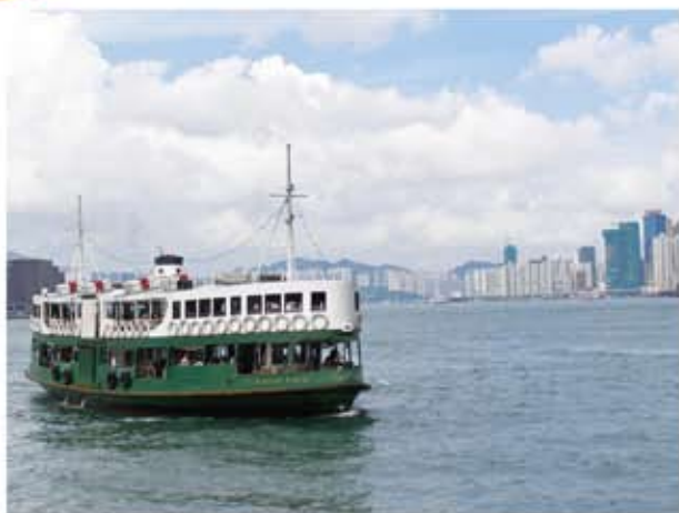
忙しい香港でひととき心休まるスターフェリーの短い航路

今年4月1日にスターフェリーの紅磡航路が廃止となった。紅磡～中環と紅磡～灣仔がなくなり、スターフェリー航路は尖沙咀～中環と尖沙咀～灣仔の2ルートだけとなった。2006年11月の中環碼頭(埠頭)移転のときに起こった大規模抗議運動のような目立った動きもなく、静かに幕を閉じた印象である。こちらは、現代香港市民が共同で体験してきたという、香港アイデンティティのキーワードとして近年よく語られる「集體回憶(集合的記憶)」を刺激するものではなかったのだろうか。