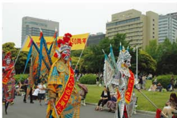
横浜開港150周年記念パレード

1994年に横浜開港祭のマリンイベントとして初めて開催された横浜ボートレースは今年で早くも第18回目を迎えました。1週目は台風の中、また2週目は絶好のドラゴン日和の中、横浜山下公園で2週4日間(5月28日(土)、29日(日)、6月4日(土)、5日(日))にわたり約160のチームが参加して開催されました。