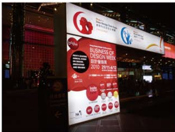
イノベーション&amp;デザインテクノロジー・エキスポ2010

昨年11月、香港フォーラムに参加した際、「イノベーション&デザインテクノロジー・エキスポ2010」を見ることができた。同エキスポは、「最新技術やデザイン・ソリューションを提供、貿易、製造及びサービス・セクターの潜在能力を引き出し、世界市場への進出を支援するワールドクラスの展示会」と位置づけられているが、ヨーロッパ各国をはじめ、日本、アジアなど多くの国がブースを構え、分野にとらわれない様々なデザインが一堂に会することにより、世界のインダストリアル・デザインの大きな流れを「感じる」ことができる絶好の機会であった。