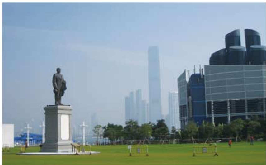
香港西營盤の中山紀念公園に建てられた孫文の銅像