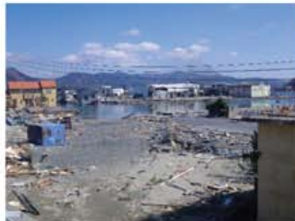
石巻市内の被害状況