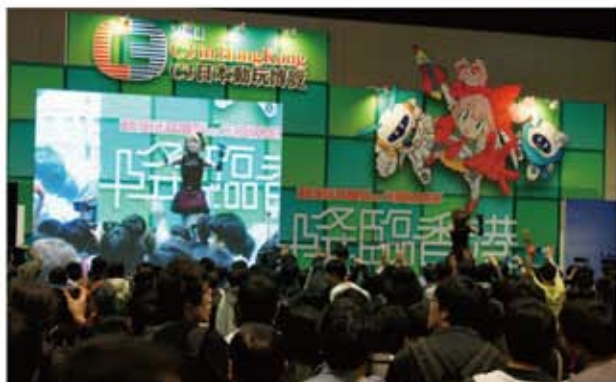
ステージイベントでは、地元の多くの香港ファンが集まり非常に盛況であった