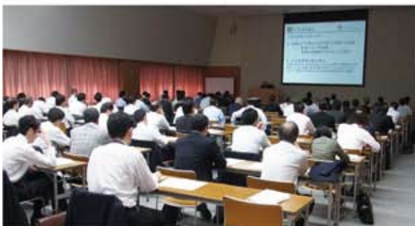
熱心に聴講する参加企業の皆様

震災後減少していた北海道を訪れる外国人観光客も回復の兆しが見え始め、ビジネスにおいても以前の活気が戻りつつあります。北海道日本香港協会事務局では、北海道と香港のビジネス、文化の交流が益々活発化するよう、取り組んで参ります。