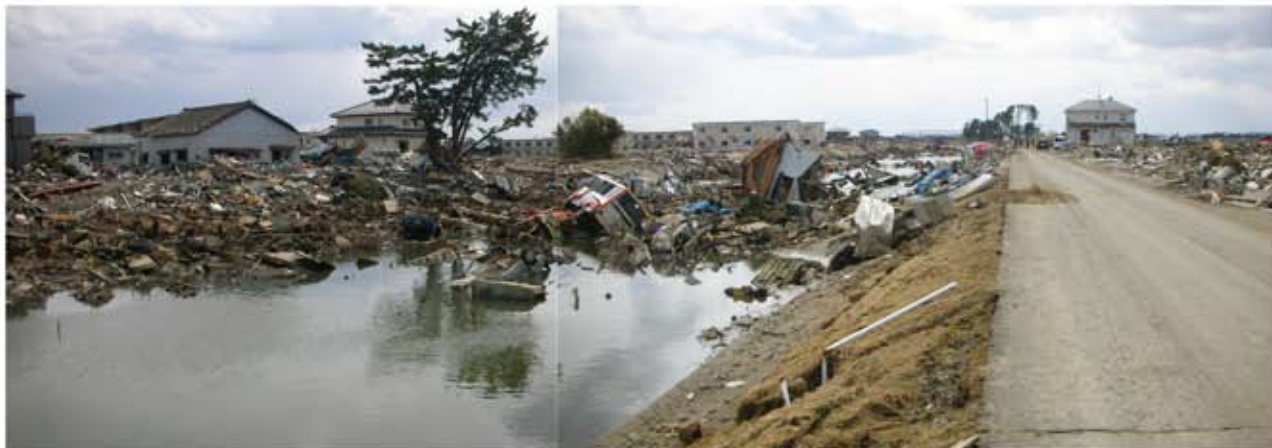
県南部名取市海岸部の被害状況

3月11日午後2時46分頃、三陸沖を震源とするマグニチュード9.0の巨大地震・大津波が発生しました。関東大震災のM7.9を上回り、1923年に日本で近代的な地震観測が始まって以来最大級のもので、5月23日現在の宮城県の被災者は、死者8,918人、行方不明者5,300人、避難者29,785人、半壊以上の居住建物82,400戸となっております。