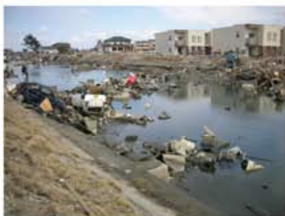
名取市内の被害状況