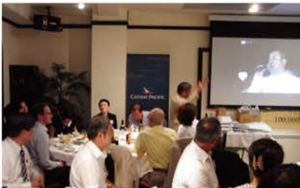
「愛は国境を超える チャリティイベント311」の上映

日本香港協会恒例のセタパーティーは7月7日木曜日に東京赤坂一ツ木通りの上海大飯店で80名を超える会員が出席、盛大に開催されました。