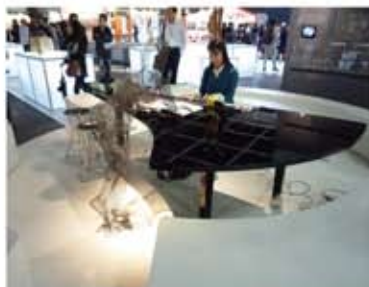
テーブルと一体となった電子ピアノ