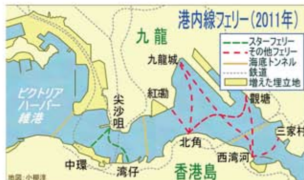
港内線フェリー (2011年)