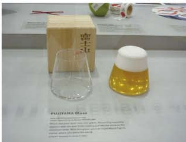
富士山をイメージしたグラス

ヤマハのテーブルと一体になった電子ピアノの大胆なデザインは、ピアノの周りにひとが集まり音楽を共有することがコンセプトだ。水戸岡鋭治氏デザインの九州新幹線つばめのシートには、柔らかい曲線を描く木製の板が使用されていて、木の温もりが伝わる肘掛は、海外から観光客にも好評であろう。富士山をイメージした「フジヤマ グラス」には思わず微笑んでしまう。北欧や韓国・中国の家電メーカーの急成長は、価格戦略だけではなく、デザインの向上も大きな要因の一つといわれている。