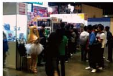
会場内、キャラクター商品の物販ブース。入場者は男性が7~8割ほど。

なお展示会初日の午後、宮城県沖での大地震が起き、場内の人々に対しても大震災の告知がなされ、2日目の開始時には被災者の方々に対して全員黙とうの時間が捧げられた。ステージイベントを行う予定であった幾人かの声優・歌手は来港キャンセルとなったが、「巨人の星」や「聖闘士星矢」「機動戦士ガンダム」の主人公役として有名な声優の古谷徹氏はイベントに出演し、数々の名セリフを披露しながら、「来られなかった人たちの為にも頑張りたい」と会場を大いに沸かせた。ステージ前におそらく2000人は集まったであろう香港のファンに向けて「みなさん、日本ガンバレ! お願いします!」と求めた氏に応じ、一緒になって日本語で「ガンバレ!」「ガンバレ!」と手を振り上げて応援していた観客の姿が私の目に今でも焼き付いている。