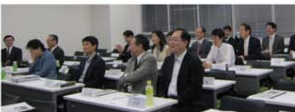
修了式における第8期CMMS受講生